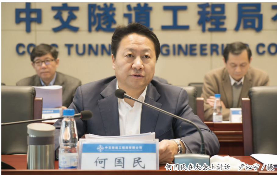
何国民在大会上讲话