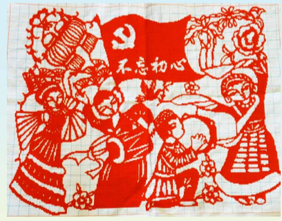
十字绣 桥隧公司 赵珮君

风好正扬帆，跨越正当时。迎着建国70周年的号角，集团公司第一次党代会召开在即，南京公司将以此为契机，进一步高要求强化管理水平、高标准推进项目管理、高质量打造精品工程，踏上新征程，迸发新力量，创造新辉煌！ 南京公司 牛文